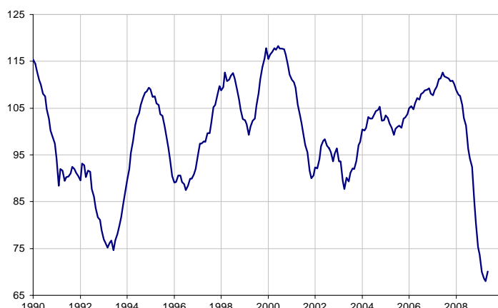
Indicateur de climat des affaires France