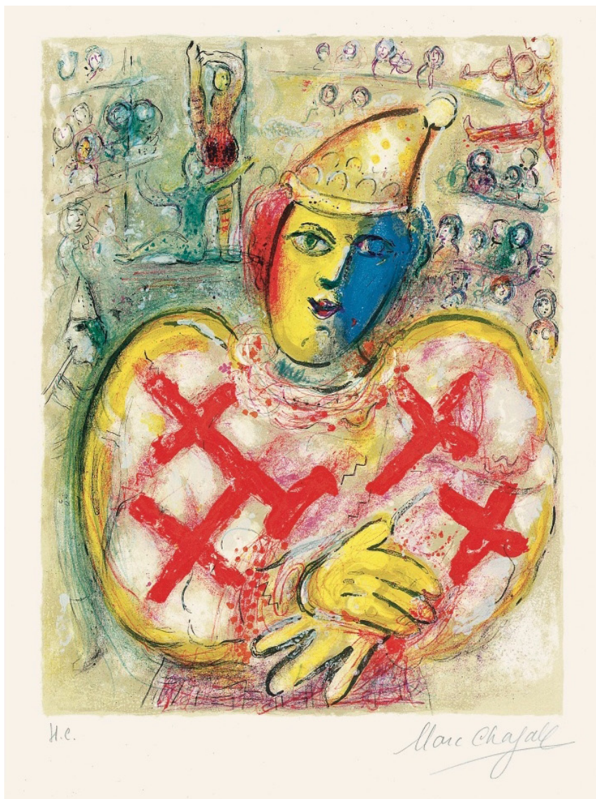
Chagall, Le Cirque , 1967. Lithographie, 51,8 x 38 cm. Collection Charles Sorlier

« Je suis sûr que Rembrandt m'aime » écrit Chagall en 1922, dans son autobiographie. Cette phrase faisant référence à l'un des grands maîtres de la gravure est révélatrice de l'engagement de Chagall dans cet art. Son oeuvre gravé est en effet considérable tant numériquement, l'artiste ayant pratiqué toutes les techniques de l'estampe,