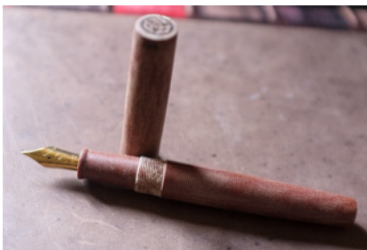
TWSBI Micarta

Le classicisme d'un stylo en laque noire avec parements dorés ou argentés ne peut que s'harmoniser avec un costume trois-pièces. La correspondance entre la noblesse des matériaux semble s'imposer d'elle-même, entre laque et soie, par exemple. Dans ce prolongement, la couleur du stylo peut rappeler ou s'accorder à celle de votre tenue du jour.